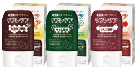
薬用 口腔ケア用ジェル リフレケア