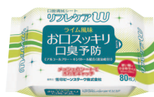
口腔清拭シート リフレケアW